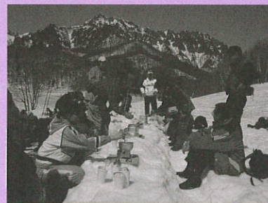
雄大な戸隠連峰を展望しながらのランチタイム