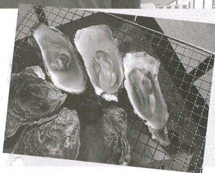
白石湖で育った小 ぶりの渡利牡蠣は、 臭みが少ないので牡 蠣が苦手な方にも おすすめ